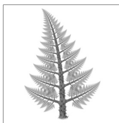
escolhas na vontade de Deus

Na primeira imagem vemos caminhos em diversas direções, sem se encaminharem para um determinado objetivo. Simbolizam decisões impulsivas, independentes de Deus, segundo a vontade espontânea do momento. O melhor que Deus planeou fica perdido e inalcançável.